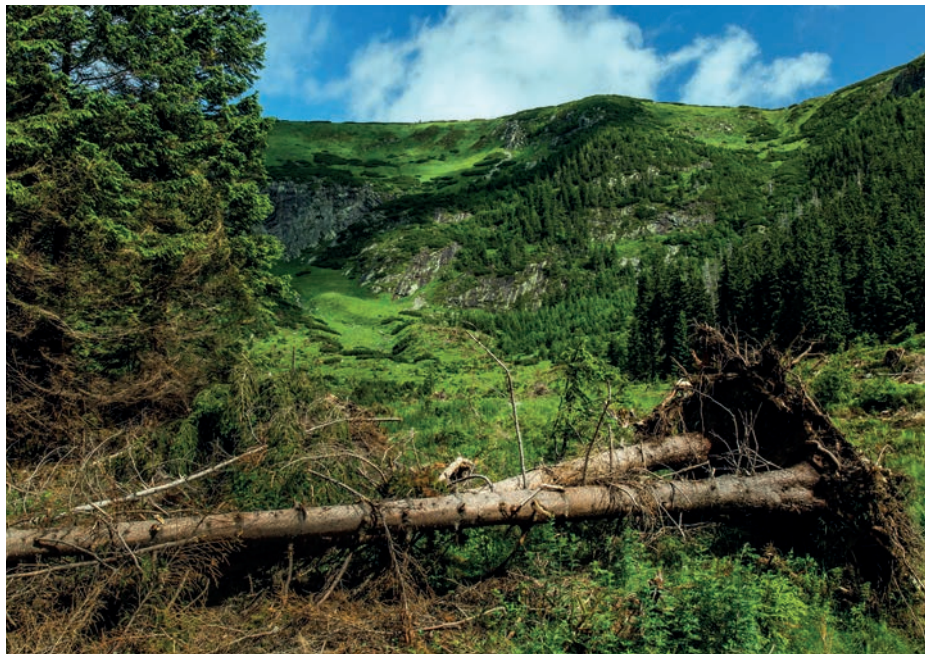
Přirozená horská smrččina na okraji Navorské jámy v západních Krkonoších ↑ Na svazích Obřího dolu již člověk léta nezasahuje, zde hospodaří příroda ↓