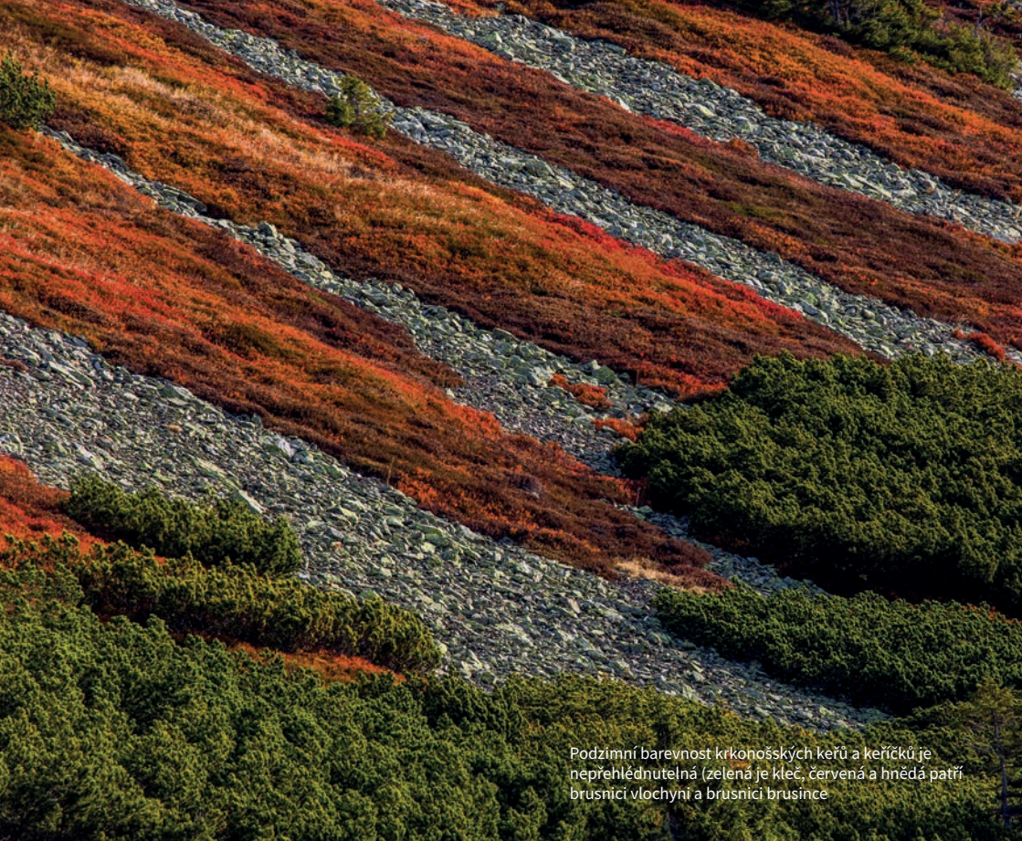
Podzímni barevnost krkonošských keřů a keříčků je nepřehlédnutelná (zelená je kleč, červená a hnědá patří brusnici vlochyni a brusnici brusince

propojené, zóny, nastal čas podrobného popisování tohoto zvláštního světa. Jaké přírodní síly tvarují tento zvláštní a vskutku unikátní svět na hřebenech našich nejvyšších hor. Svět připomínající vzdálené končiny skandinávské krajiny, se kterou však Krkonoše byly v dobách ledových a postglaciálu dlouhodobě propojeny.