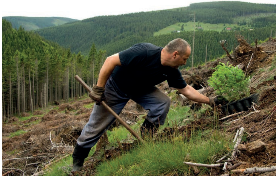
Zalesňování holiny je v horském terénu náročná práce ↓