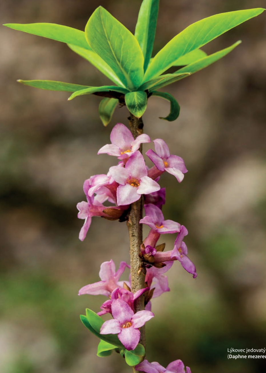
Lýkovec jedovatý ( Daphne mezereum )

Druhá pestrost listnatých a smíšených lesů se však odráží i v úžasné barevné a tvarové rozmanitosti listů a květů, v hojných tvarech plodů a semen, od bobulí