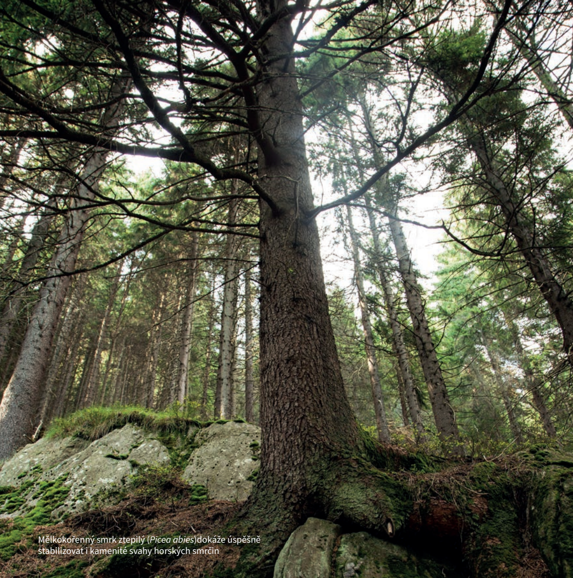
Mělkokořený smrk ztepilý ( Picea abies ) dokáže úspěšně stabilizovat i kamenité svahy horských smrčín

tam vystřídá jeho blízké příbuzný pabuk, smrky či modříny nahradí vřesovce, a mezi dřevinami tam kralují i bizarní starčkovce či lobélie. Za vši tou rozmanitostí se skrývá neúprosné soupeření dřevin se složitostmi horského prostředí.