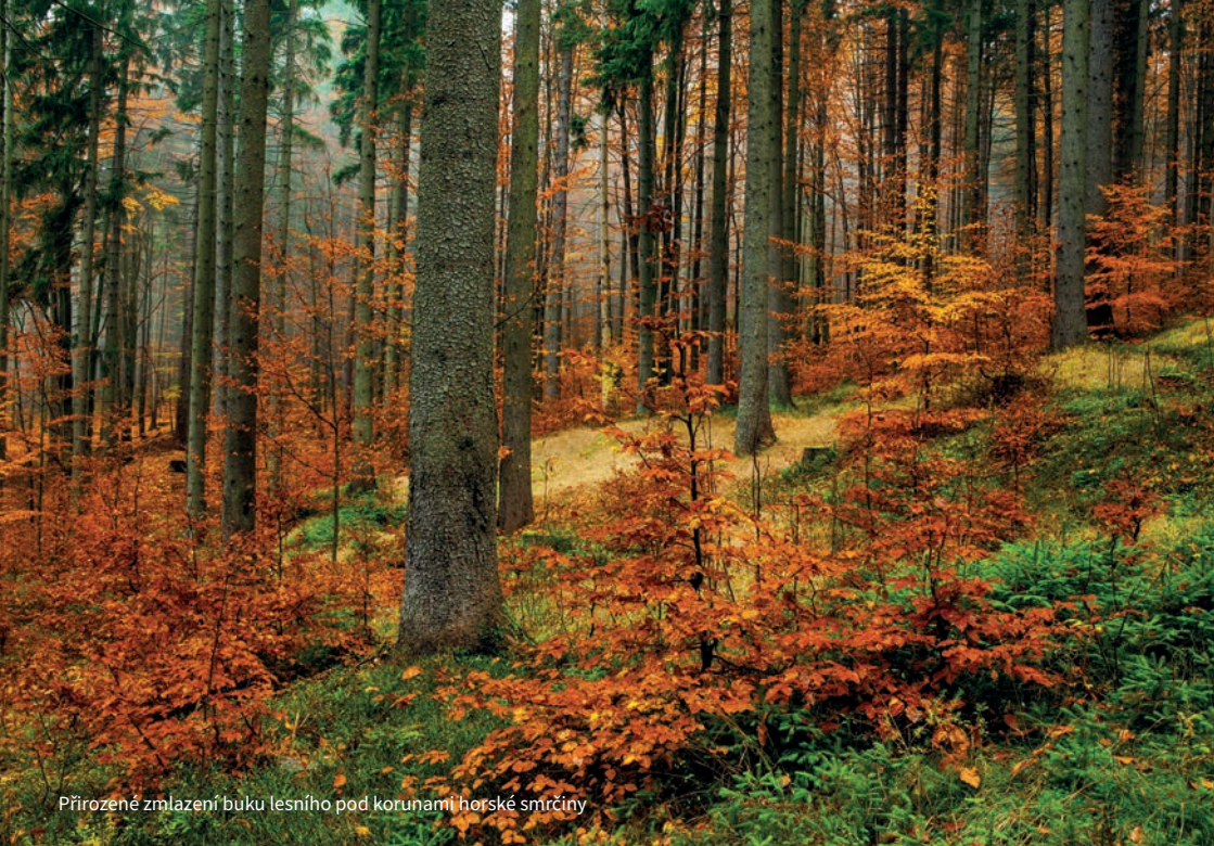
Přirozené zmlazení buku lesního pod korunami horské smrčiny

(např. smrk nebo jasan), až po hluboce kořenící dřeviny (buk). Kořeny jsou významnou součástí těla dřevin, neboť mají především stabilizační funkci pro často mnohatusňové jedince, ale především jsou dokonale fungující pumpou, která dokáže vytlačit z půdy vodní roztok s rozpuštěnými minerály desítky metrů vysoko do olistěných korun, kde ho rostliny potřebují při fotosyntéze. U mnoha druhů dřevin existuje zvláštní symbióza mezi jemnými kořínky a kořáním a podhoubím mnoha saprofytických hub, tzv. mykorrhizy, plnící důležité poslání ve výživě dřevin.