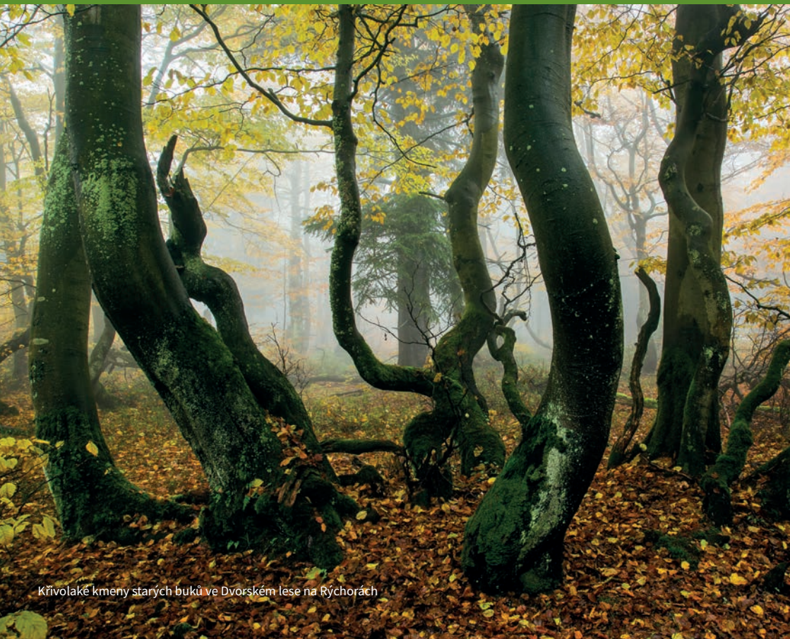
Křivolaké kmeny starých buků ve Dvorském lese na Rýchorách

Krátké vegetační období, rychlé střídání ročních period, dostatek či nedostatek vody, to vše určovalo, které dřeviny se na svazích Krkonoš zabydlí. Zda to budou listnáče nebo ve vyšších polohách jehličnany. V Krkonoších to byl zejména souboj mezi bukem a smrkem, či borovicí klečící nad hranicí lesa. V jiných evropských horách nebo světových horách se dominantní dřeviny mění – v Alpách se rozprostírá království zlatožlutých modřínů, vysoko v Himálaji některých bříz, jedlí či pěnišníků, v severoamerických horách pak jedlovce a sekvojovce. Jestliže však navštívíme pohoří na jižní polokouli, tak buk