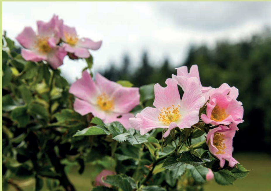
Růže šípková ( Rosa canina ) patří k nejčastějším druhům růží v Krkonoších ↑ Od úpatí Krkonoš až po nejvyšší polohy hor roste brusnice borůvka ( Vaccinium myrtillus ) ↓