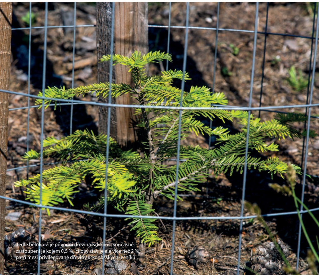
Jedle bělokorá je původní dřevina Krkonoš, současné zastoupení je kolem 0,5 %, cílový stav je ale více než 2 %, patří mezi privilegované dřeviny krkonošských lesníků

Při úpatí hor dnes existují desítky stro-mořadí a parků, kde jsou pěstovány četné druhy dřevin, které můžou pro přirozenou dendroflóru Krkonoš představovat značné nebezpečí. Příkladem může být čím dál hustější rozšíření některých nepůvodních javorů podél silnic v Podkrkonoší, masivní