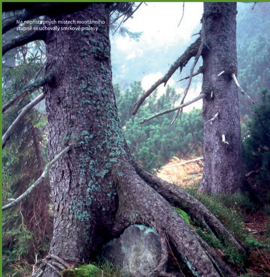
Na nepřístupných místech montánního stupně se uchovaly smrkové pralesy

Nescházelo však mnoho a jehličnatá tajga na svazích Krkonoš mohla zmizet. V závěru minulého století byla pod obrovským tlakem průmyslových imisí, smrčiny velkoplošně odumíraly, smrky přestaly kvést a plodit, následně pak probíhalo (a stále probíhá) opakované kalamitní přemnožení býložravého hmyzu a různých houbových onemocnění. Navzdory všemu, ale i díky velkému úsilí správců KRNAP má smrková tajga v Krkonoších před sebou opět velkou perspektivu přežít.