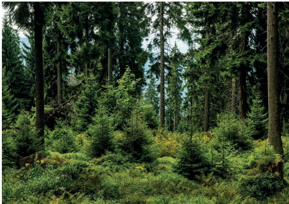
Přirozená obnova horské smrčiny ↑