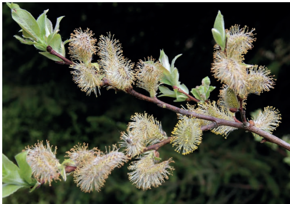
Samčí jehnědy vrby jívy ( Salix caprea ) ↑ Janovec metlatý pravý ( Sarothamnus scoparius subsp. scoparius ) roste na mnoha místech při úpatí Krkonoš ↓