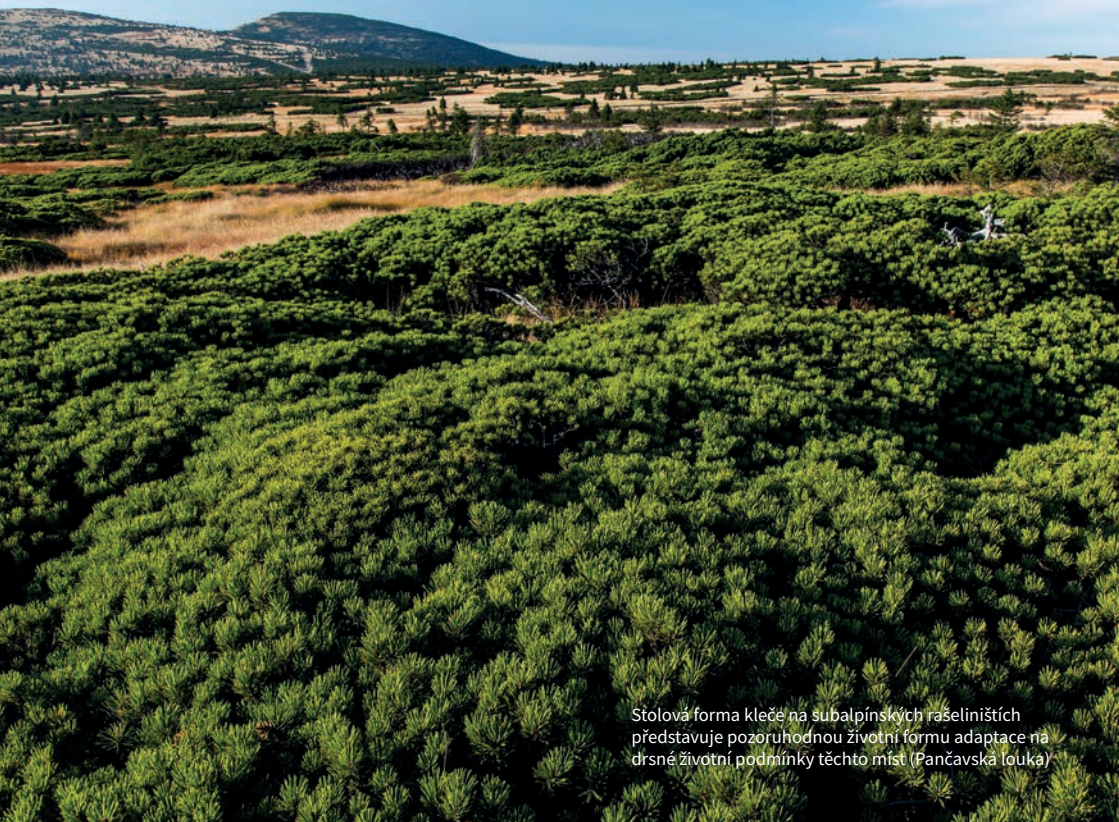
Stolová forma kleče na subalpínských rašeliništích představuje pozoruhodnou životní formu adaptace na drsné životní podmínky těchto míst (Pančavská louka)

devším severského hosta v Krkonoších – ostružiníku morušky. Rašeliniště na hřebenech Krkonoš se v dávné minulosti stala místem pozoruhodného setkání dvou dřevin – borovice kleče, která má v Krkonoších nejsevernější naleziště svého evropského rozšíření a miniaturního keříčku ostružiníku moruška. Vzniklo tak unikátní společenství těchto dvou organizmů, které na stránkách místní populační literatury často najdete po názvem morušková kleč. Nikde jinde na světě se již nevyskytuje.