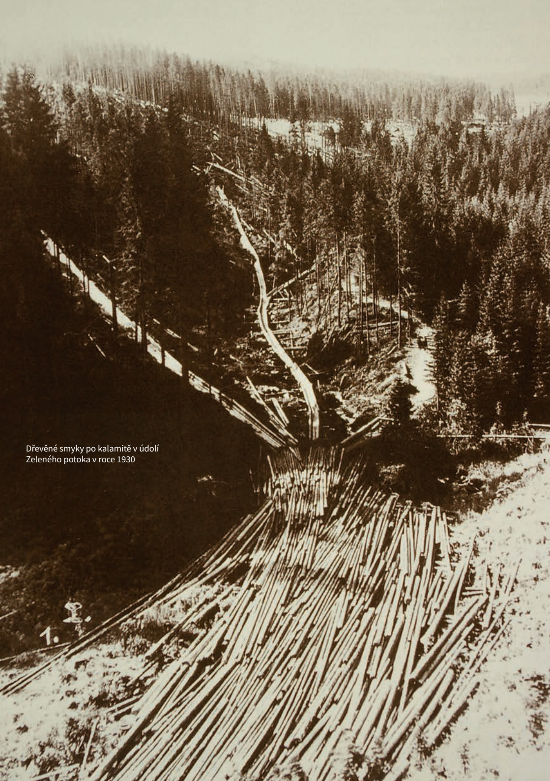
Dřevěné smuky po kalamitě v údolí Zeleného potoka v roce 1930