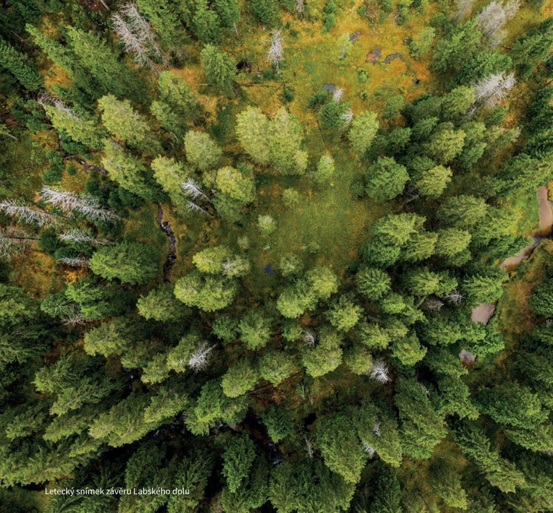
Letecký snímek závěru Labského dolu

a křoviny předmětem rozsáhlého mýcení, aby se zvětšila rozloha senišť a pastvin. V 19. a 20. století se pak horské lesy staly prostředím další vlny obrovské exploatace, neboť se jednalo o ekonomicky rychle využitelný, či spíše zneužitelný přírodní zdroj. Bylo tomu tak i v Krkonoších, kde postupně mizely původní horské lesy, aby byly nahrazeny smrkovými, rychle rostoucími, avšak geneticky méně vhodnými porosty.