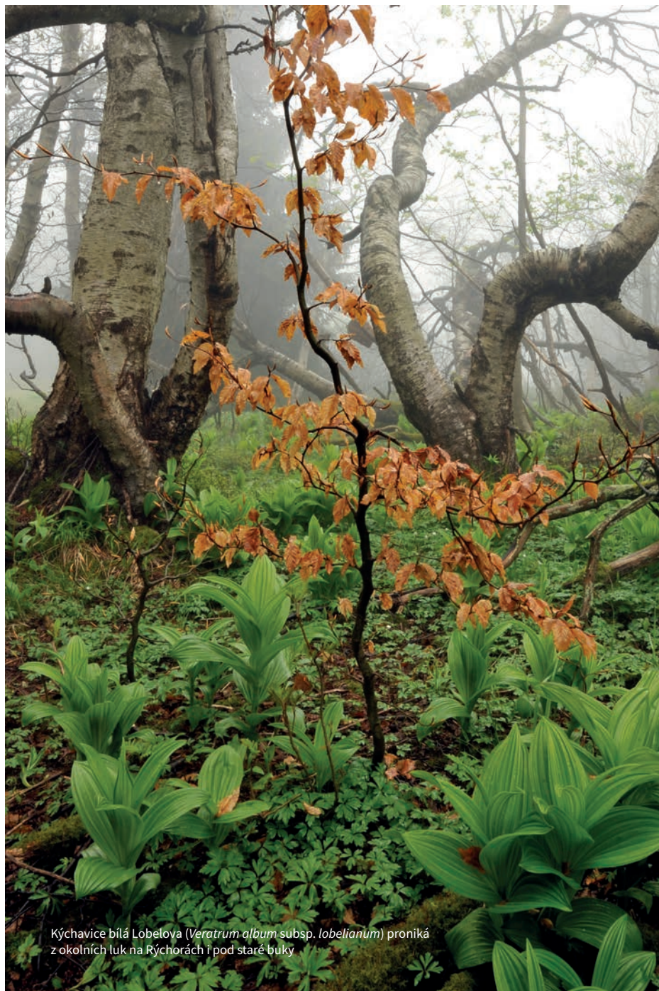
Kýchavice bílá Lobelova ( Veratrum album subsp. lobelianum ) proniká z okolních luk na Rýchorách i pod staré buky