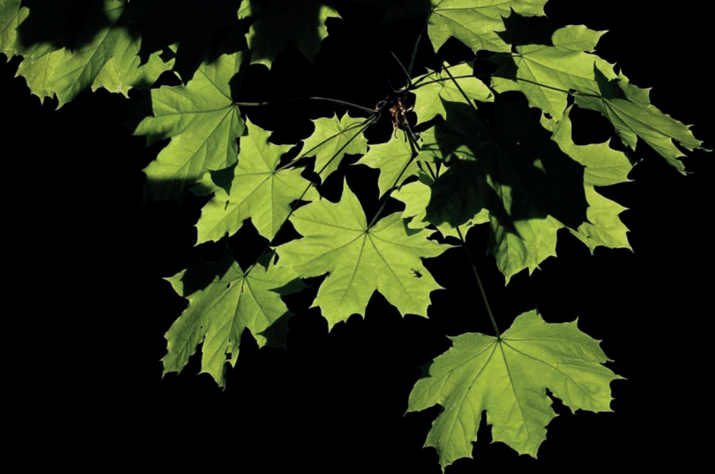
Javor mléč ( Acer platanoides )

statnou přirozenou taxonomickou skupinu, ale jen jako pomocnou třídící kategorii, zahrnující rostliny z nejrůznějších rodů a čeledí. Jediným spojujícím znakem všech dřevin je přítomnost dřevnatých podpůrných pletiv, především v prýtech (kmenech a větvích) a kořenech. V tom spočívá základní rozdíl mezi dřevinami a bylinami, jejichž nadzemní orgány v našem klimatu na konci vegetačního období odumírají a zimní měsíce přežívají pouze podzemní (vzácněji přizemní) části bylin, kde jsou uloženy zásobní látky. Dřeviny naopak ukládají svou produkci v kmenech, větvích a větévkách, ale i v kořenech, a hospodaří se zásobními látkami ve svých tělech mnohem úsporněji.