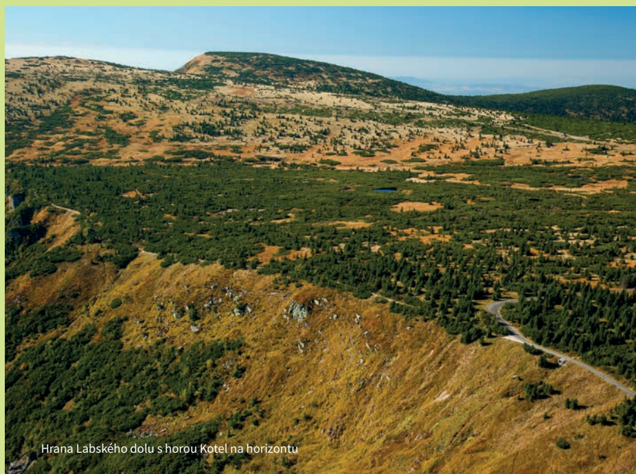
Hrana Labského dolu s horou Kotel na horizontu

dobu. Nízké keře a keříčky jsou pro takové prostředí lépe přizpůsobeny a postupně stromy nahrazují. V ekotonu AHL jsou letorosty smrku každoročně poškozovány mrazem, větrem, sněhem a ledem, výška stromů se proto se stoupající nadmořskou výškou snižuje, až je zcela nahrazují porosty borovice kleče, břízy karpatské, vrby a jeřábů. Drsnějšímu klimatu se tady však stromy snaží přizpůsobit i klonální strategií růstu – zakořeňováním přizemních větví, za vzniku tzv. smrkových rodin. Zakořeňování poléhavých větví je naopak zcela obvyklé u kleče, která smrk na svazích Krkonoš postupně vystřídá. Také laviny a plazivý sníh výrazně ovlivňují podobu dřevin na AHL. Opakované zlomy kmenů a větví mají za následek tvorbu bizarních lavinových forem dřevin.