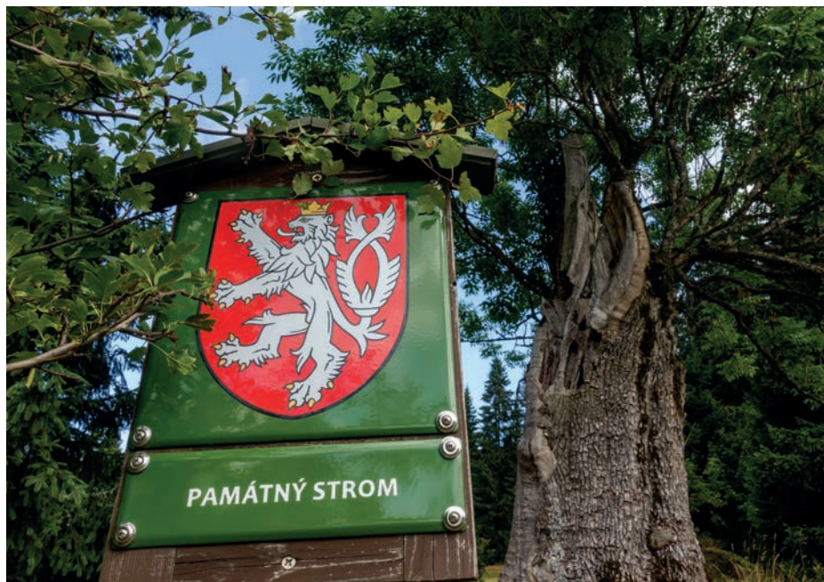
Památný strom požívající zákonnou ochranu ↑ Jarní aspekt lesů na úpatí Krkonoš je součástí neopakovatelné atmosféry zdejší lesů ↓