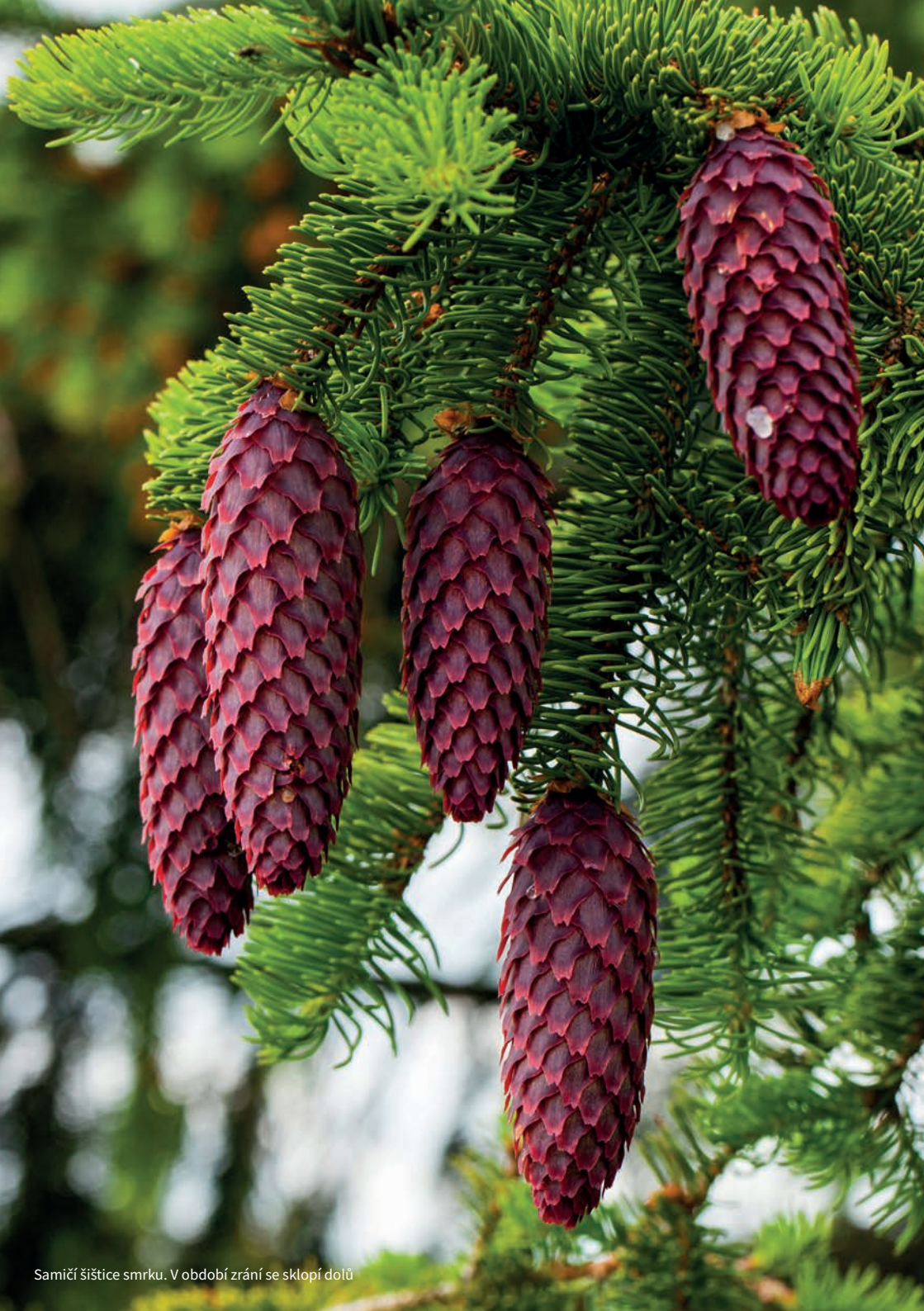
Samičí šištičky smrku. V období zrání se sklopí dolů