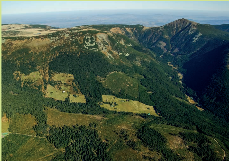
Mezi Studniční horou a Sněžkou je Obří důl ↑ Horskou smrččinu vystřídá nad alpskou hranicí lesa na svahu Krkonoše borovice kleč ( Pinus mugo ) ↓