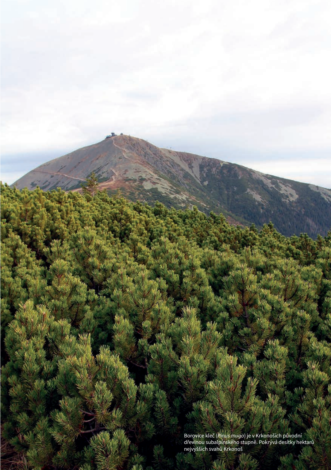
Borovice kleč ( Pinus mugo ) je v Krkonoších původní dřevinou subalpínského stupně. Pokrývá desítky hektarů nejvyšších svahů Krkonoš