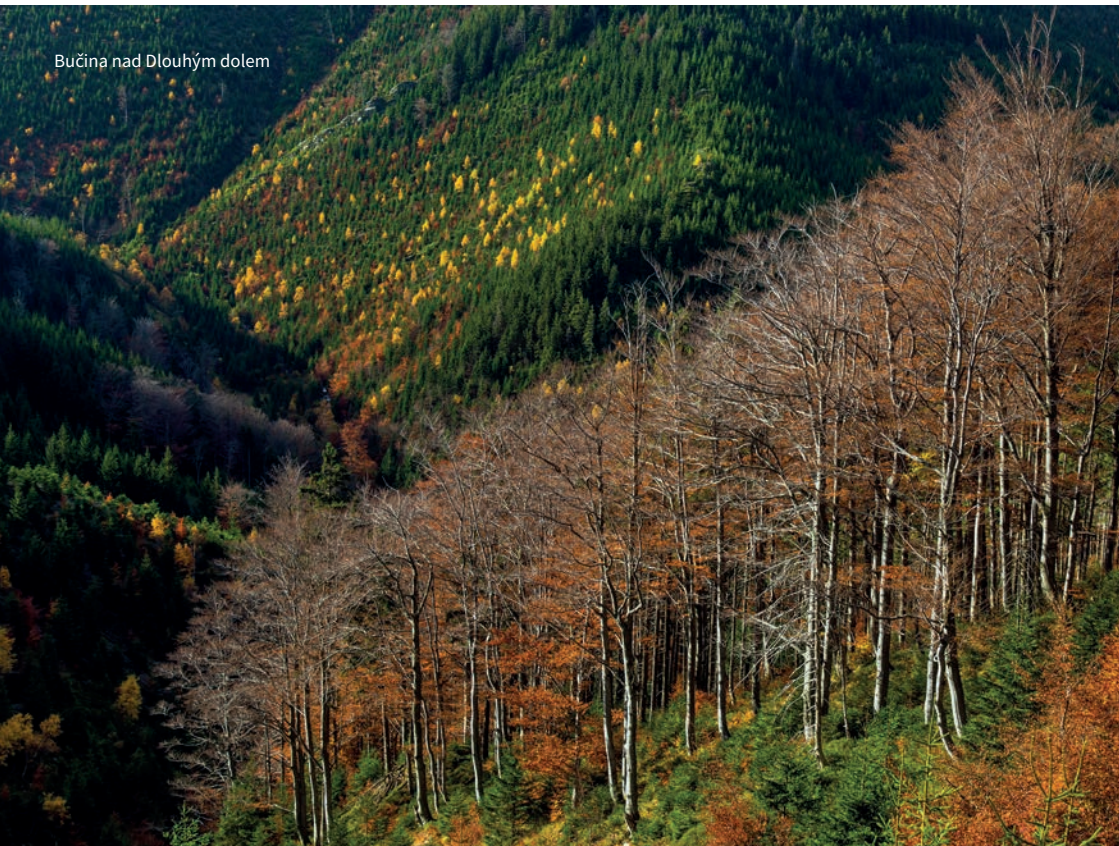
Bučina nad Dlouhým dolem

Velkou rozmanitostí se vyznačují kořeny dřevin, od mělce kořenících druhů