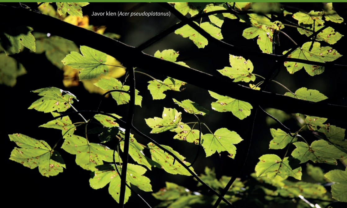
Javor klen ( Acer pseudoplatanus )

borovice černá borovice limba borovice vejmutovka douglaska tisolistá dub bahenní a d. červený hlohyně šarlatová hlošina úzkolistá javorovec jasanolistý jedlovec jírovec maďal ořešák královský pámelník bílý růže svraskalá smrk pichlavý šerík obecný topol bílý trnovník bílý