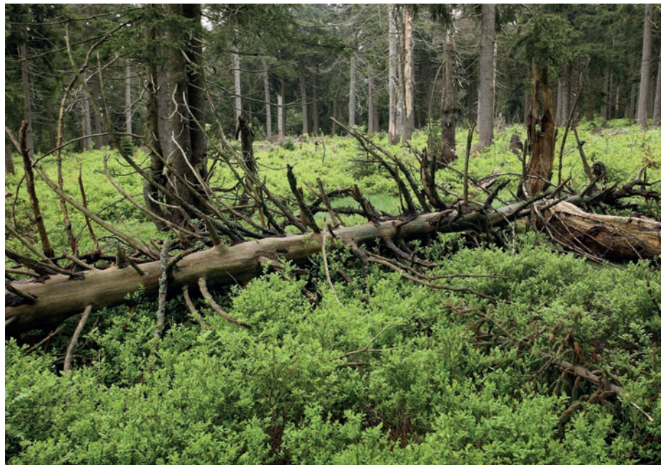
Stáří ustupuje nové generaci lesa ↑ Jaro je tady a nic už nezastaví rytmus života v jarní bučině ↓