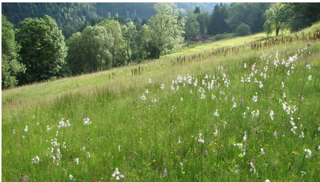
Lokalita Nad Velvetou před sečí, na obrázku je patrný suchopýr úzkolistý a fialový prstnatec