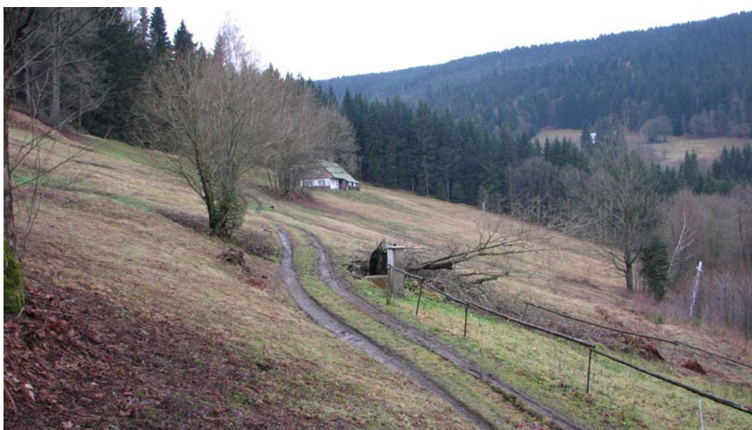
Lokalita Nad Velvetou po seči.