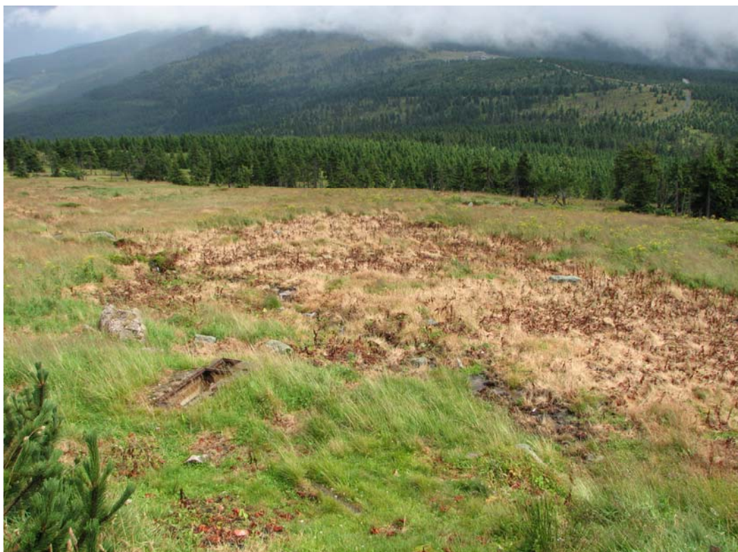
Petrova bouda – lokalita po postřiku šťovíku alpského