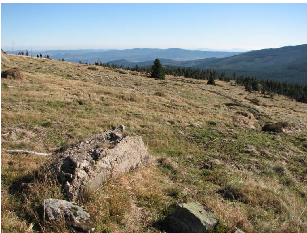
Petrova bouda – lokalita po provedení seče a úklidu travní hmoty