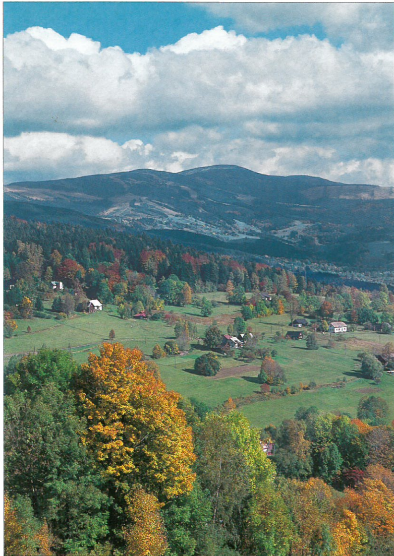
◀ Mozaika přírodních i člověkem ovlivněných stanovišť v Krkonoších