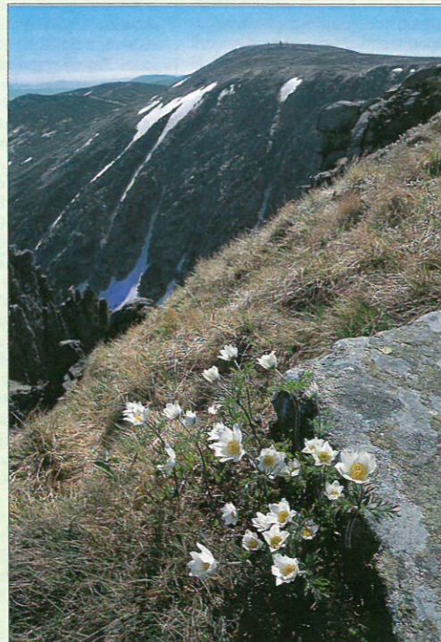
Jedinečné stanoviště karových údolí