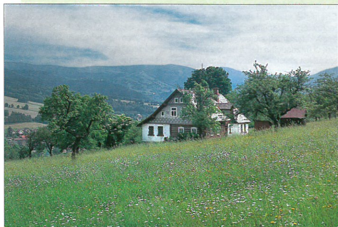
Pravidelná lidská péče o přírodní prostředí dala vznik druhově pestřím horským loukám