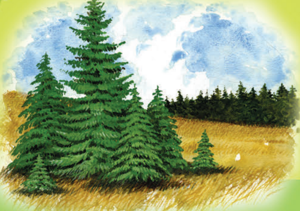
Biogrupy świerkowe Grupki świerków w różnym wieku, powstałe tak, że gałęzie starych drzew zakorzeniły się tam, gdzie dotykały ziemi.