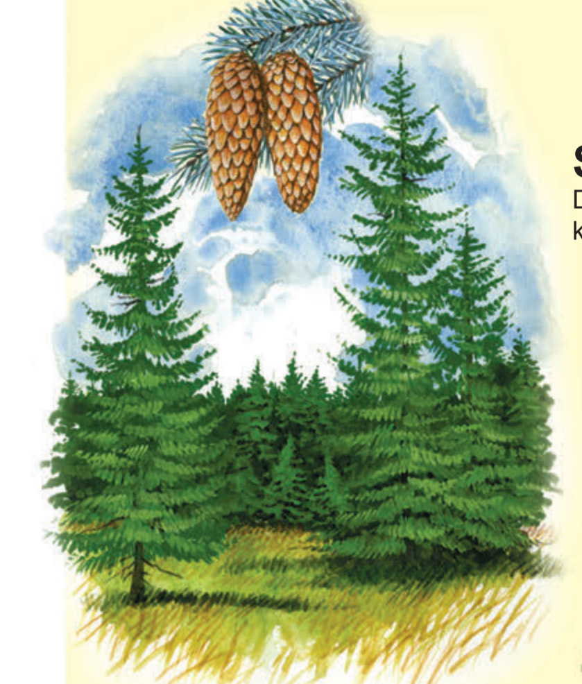
Jodła pospolita Kiedyś pospolite, dziś ze względu na kwaśne deszcze rzadkie drzewo iglaste.