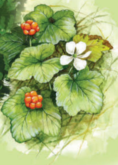
Kosówka z maliną moroszką Biocenoza kosodrzewiny i maliny moroszki występująca tylko w Karkonoszach.