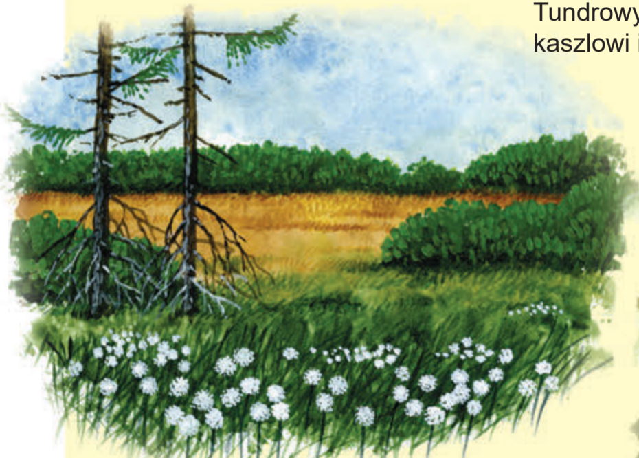
Torfowiska Ponad 700 hektarów torfowisk wpisanych jest na międzynarodową listę ważnych mokradel.