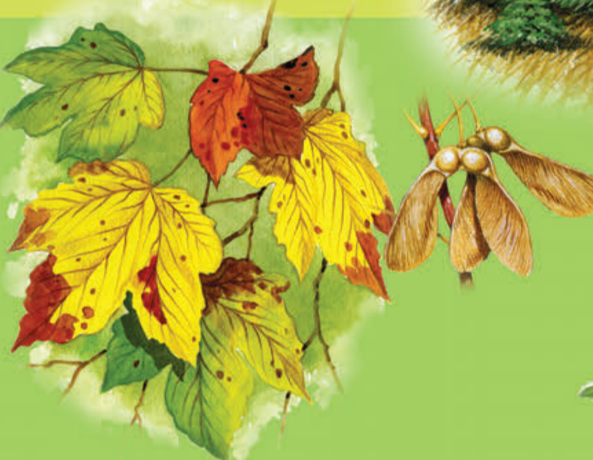
Klon jawor Jesienią jego liście sprawiają, że zbocza zyskują pastelowe odcienie.