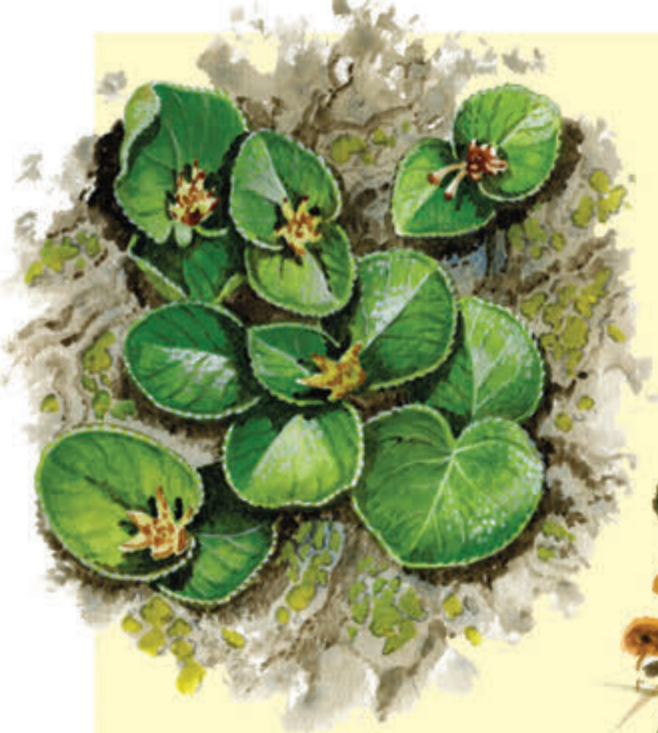
Wierzba zielna Drobna krzewina, która poza Karkonoszami występuje tylko w Tatrach i na Babiej Górze.