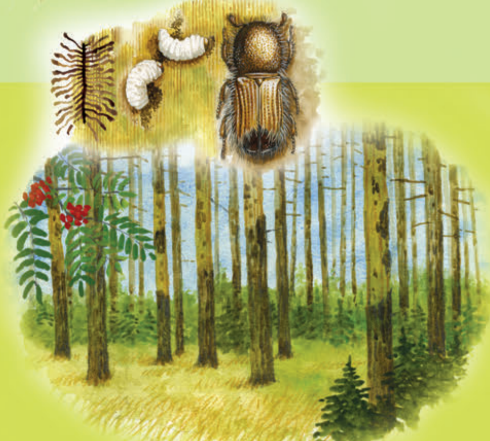
Drzewo trocinkowe – świerk Kornik stanowi naturalną część lasu, zaatakować może tylko osłabione drzewo.