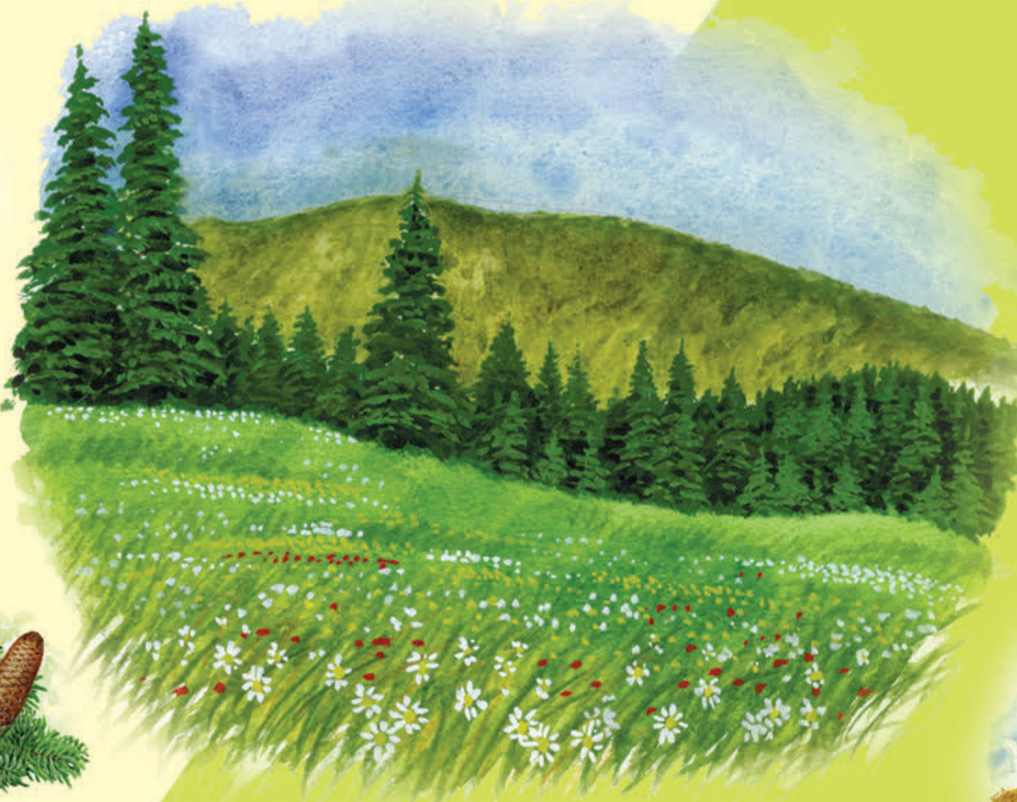
Łąki górskie Powstały w miejscach, gdzie wycięto las, a koszenie trawy i wypasanie na nich zwierząt nie pozwoliły go przywrócić.