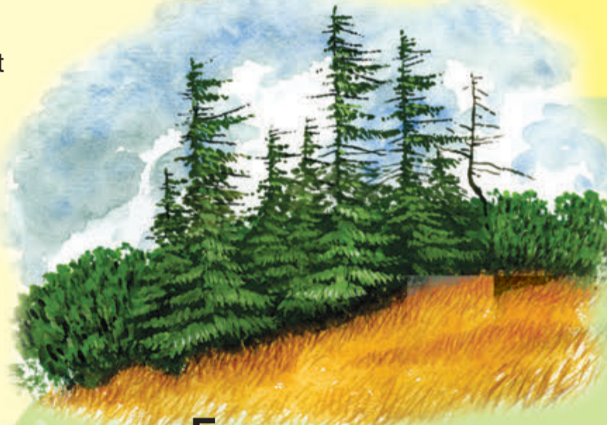
Forma chorągiewkowa świerka Świerki wyższe, niż kosodrzewina z gałęziami od zawietrznej strony pnia.