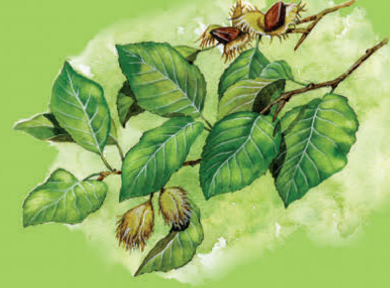
Buk zwyczajny Najważniejsze drzewo liściaste Karkonoszy, powinien stanowić ok. 30% drzew w karkonoskim lesie.