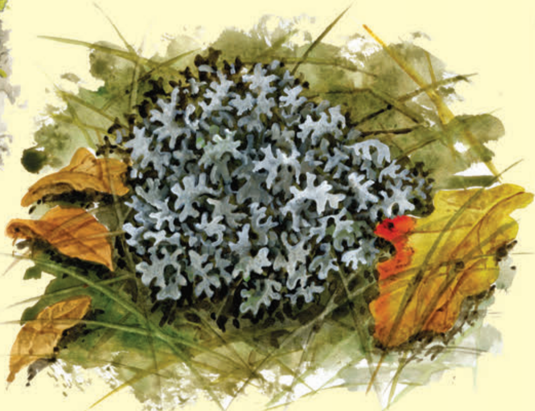
Płucnica islandzka Tundrowy porost, używany przeciw kaszlowi i problemom żołądkowym.