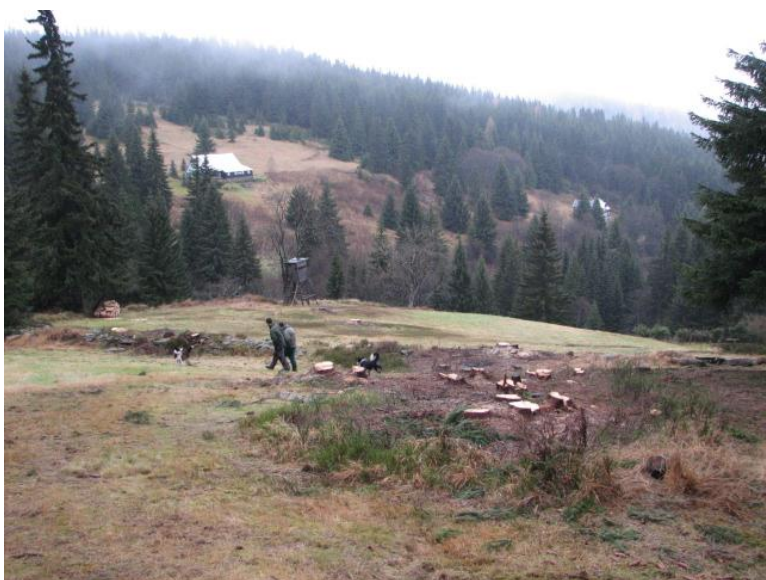
Foto č. 4: Výřez vzrostlých náletových dřevin na Velkých Tippeltových Boudách (fáze III.)