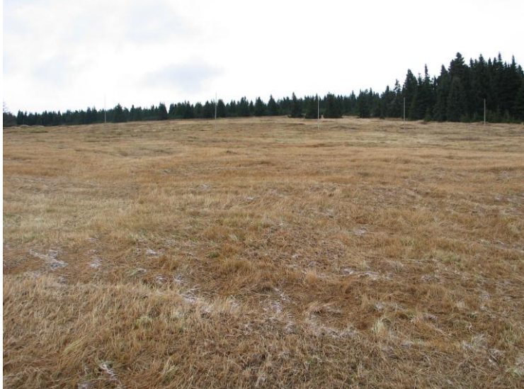
Foto č. 1 a 2: Seč na Liščí louce. Dlouhodobě neudržované pozemky. Na fotografii je zřejmé velké množství stařiny. Druhá fotografie ukazuje louku po seči.