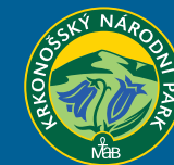
Vytlačeno na recyklovaném papíře.

Vydala Správa Krkonošského národního parku roce 2022.