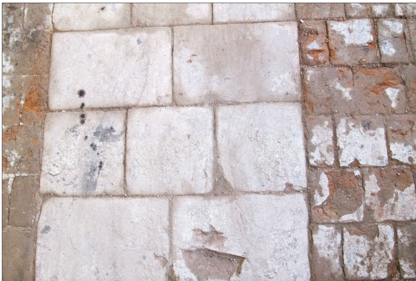
Při rekonstrukčních pracích ve vrchlabském klášteře se odkrývají věci, které jsme dosud znali jen z černobílých fotografií. Třeba krásná dlažba křížové chodby v ambitu – dlážděná místním červeným pískovcem (pás uprostřed) kombinovaným s okraji z dlažby z červených pálených cihel