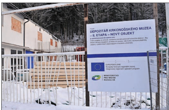
Staveniště budoucího deponitáře Krkonošských muzeí Správy KRNAP v Hořejším Vrchlabí