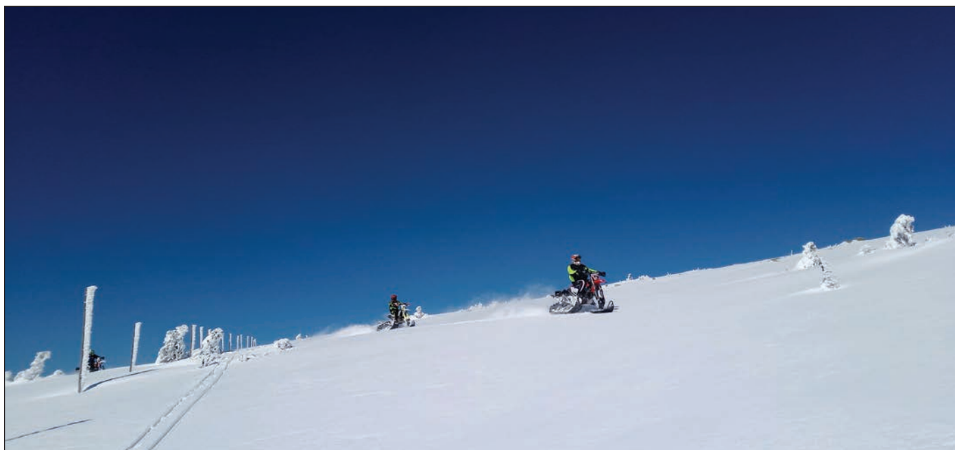
Skupinku zachytili i běžní turisté na hřebenech, zde při přejezdu Vysokého kola