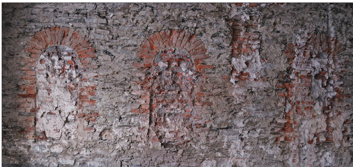
I v takových technických budovách, jako je ta v Hořejším Vrchlabí, kde roste nový deponitář Krkonošského muzea Správy KRNAP, se odkrývají výtvarně zajímavé pohledy