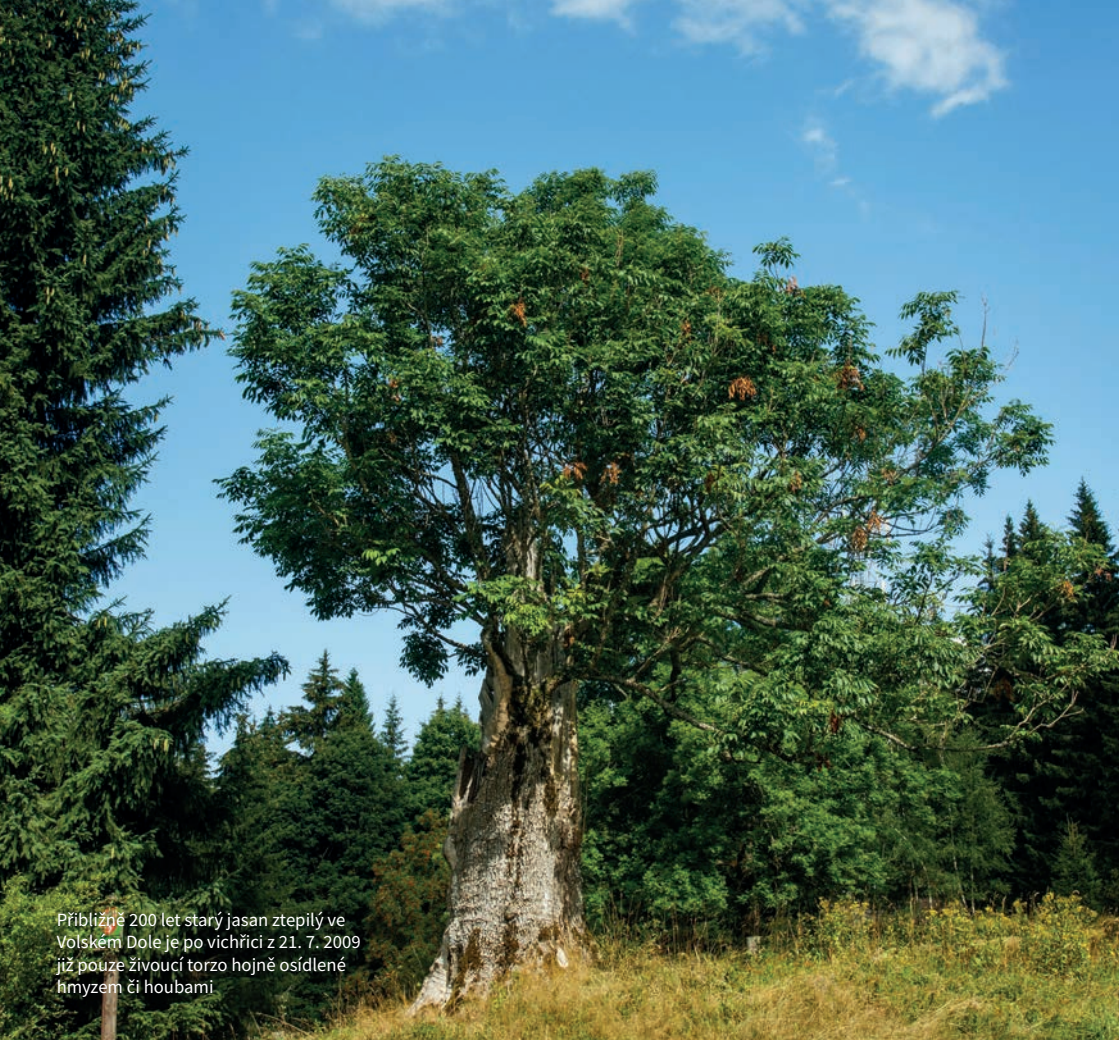
Přibližně 200 let starý jasan ztepilý ve Volském Dole je po vichřici z 21. 7. 2009 již pouze živoucí torzo hojně osídlené hmyzem či houbami

certifikátů lesního hospodaření, kterých je Správa KRNAP držitelem. Druhová, prostorová i ekologická stabilita krkonošských lesů se zlepšuje. V lesích se zvyšuje zastoupení dříve hodně redukované třeseň ptačí, lípy, jilmu... Na různých místech Krkonoš rostou prastaré druhy dřevin, které získaly statut chráněné přírodní památky (duby, buky, jedle, jasan, lípy). Správa KRNAP zřídila ve vrchlabské klášterní zahradě ovocný genofundový sad a štěpnici, kde se podařilo zachránit řadu starých místních odrůd ovocných stromů (jabloní, hrušní, třešní,